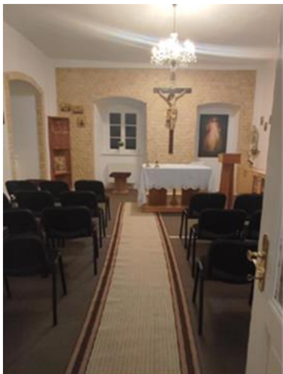
Kaple po rekonstrukcji